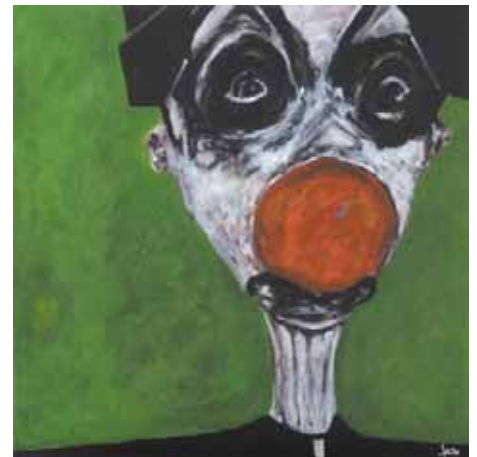
UJAC 'green' a/toile (90x90cm)