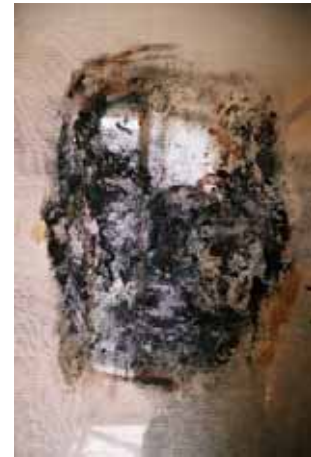
Apparition (50 x 40 cm) Technique mixte sur gaze et miroir 2008

Née à Paris, d'origine espagnole. Vit et travaille à Paris