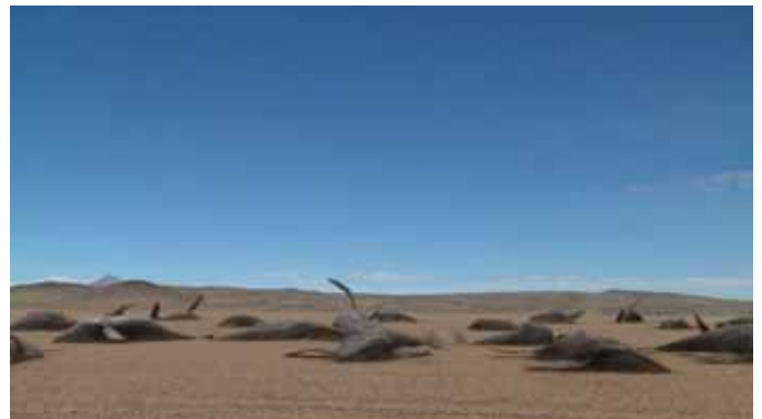
centipede sun 2010

Mihai Grecu : né en Roumanie en 1981; diplômé de l'ESAD Strasbourg et du Fresnoy, Studio National des Arts Contemporains, il vit et travaille à Paris. Oscillant entre art vidéo, cinéma et animation 3D, son imagerie singulière met en œuvre, dans une atmosphère déshumanisée, des visions oniriques traversées par des objets parasites, architectures modifiées et personnages-symboles. Son travail est montré dans des nombreux festivals de film (Locarno, Rotterdam, Festival du Nouveau Cinéma à Montréal, videoformes) et expositions ("Dans la nuit, des images" au Grand Palais, "Labyrinth of my mind" au Cube, "Studio" à la Galerie Les filles du Calvaire, etc).