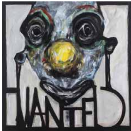
UJAC 'wanted' a/toile (90x90cm)