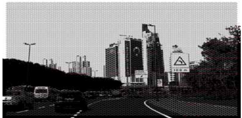
Echangeur_IMGP3612 (75x150 cm) assemblage de 4 surfaces en acier perforées

Né au HAVRE en 1972, Jean-Baptiste Perrot vit et travaille à Paris.