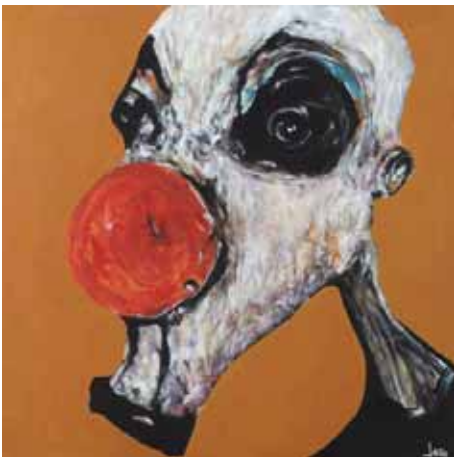
UJAC 'beige' a/toile (90x90cm)

L'homme n'est pas héroïque, affublé d'un nez rouge le corps est désacralisé, là reste l'effet de ce corps. Parfois spectrale, l'empreinte d'une présence humaine témoigne d'un effort de vivre.