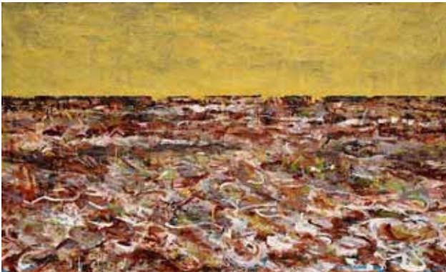
Marine, huile sur papier, 2008, (80x130 cm)

Au même titre que la recherche chromatique de Mauro Bordin's se révèle inépuisable, cette peinture nous entraîne dans une vision en devenir de l'existence. Elle concrétise sur la toile une vie qui se délite et se régénère dans une même unité de lieu et de temps.