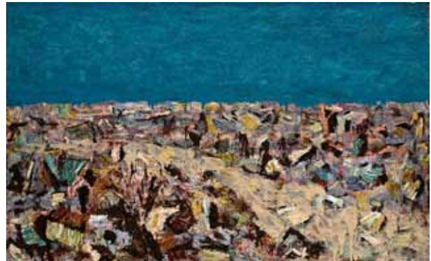
Trash, huile sur papier, 2008, (80x130 cm)