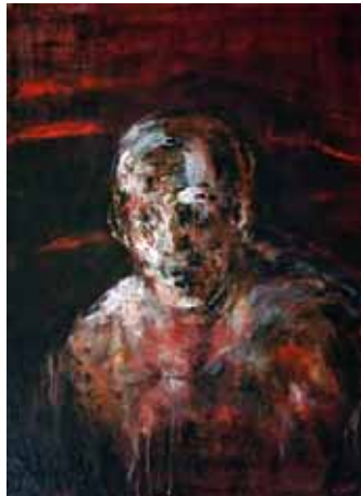
Regard (73 x 60 cm) Huile sur toile - 2008