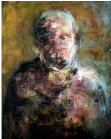
Passage (46 x 38 cm) Huile sur toile - 2008

Le corps, lieu où s'expriment nos sentiments, trouve sur la toile l'espace lui permettant de définir par la matière, une multitude d'émotions. Peu à peu, l'expression picturale tend à s'épurer, et me mène vers la suppression du châssis et le choix d'un support d'une grande finesse et légèreté, celle de la gaze. Un voile sur lequel je reconstitue une peau qui laisse place à une autre histoire, composée de nos fêlures et nos failles. Un support, presque comme animé d'un souffle qu'évoquent les suspensions de cette nouvelle série intitulée "Apparitions".